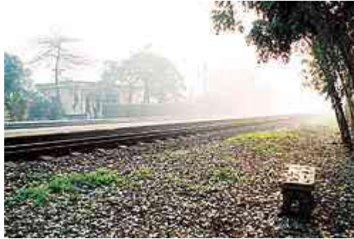
Đằng sau lùm cây cạnh ga Cẩm Giàng là trại văn chương Tự Lực Văn Đoàn

Thế kỷ trước, ở phố huyện Cẩm Giàng, Hải Dương, trong gia tộc Nguyễn Tường có hai người phụ nữ được nhắc nhiều trong đời sống văn học. Chồng, con say mê hoạt động văn chương, xã hội... còn họ lùi vào phía sau với thiên chức làm mẹ, làm vợ. Danh vọng, thành công của những người đàn ông đó có một phần ở sự tảo tần của họ.