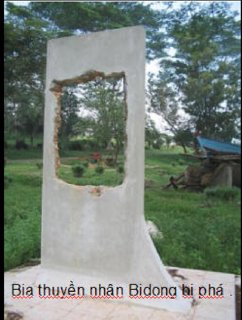
Bia thuyền nhân Bidong bị phá