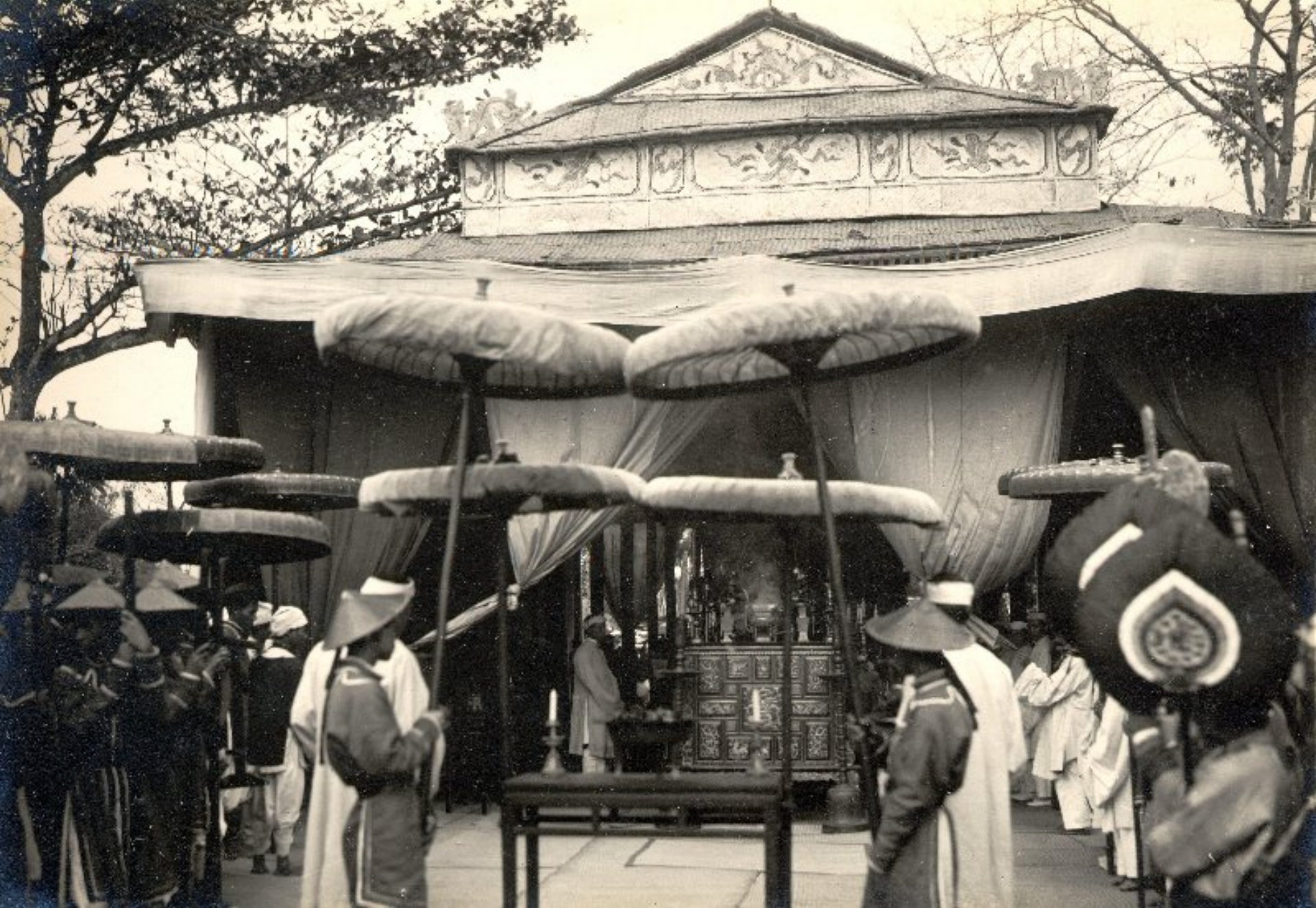
► Cúng bái trên đường đi