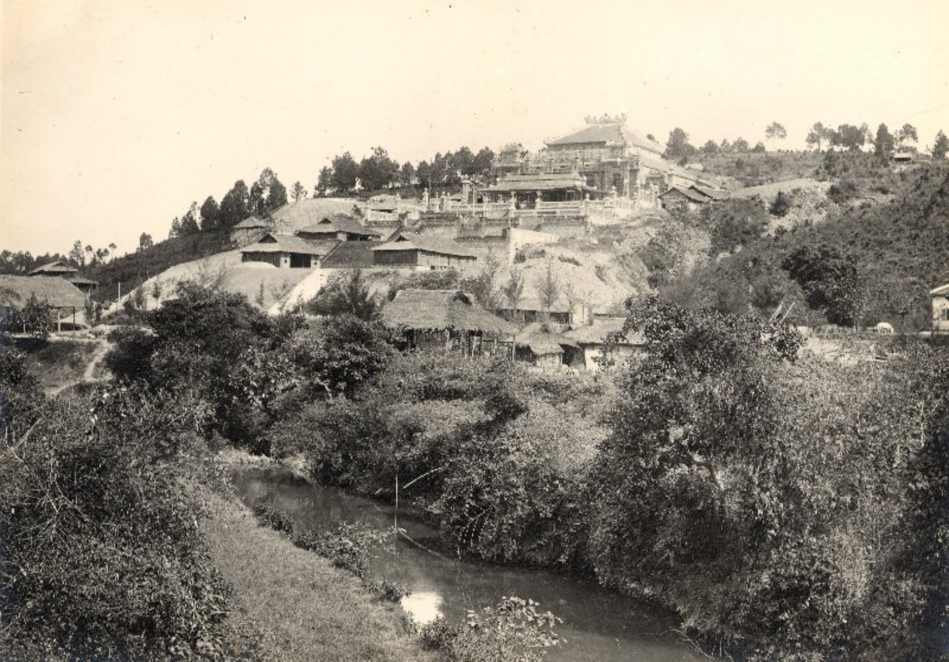
► Toàn cảnh làng