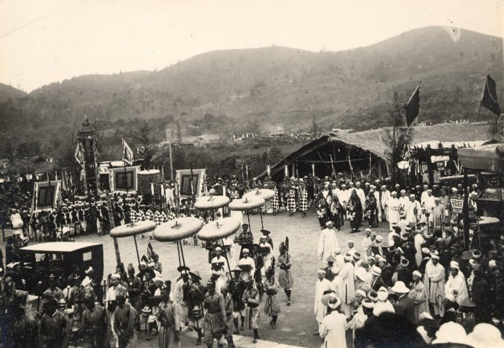
▶ Vào lăng