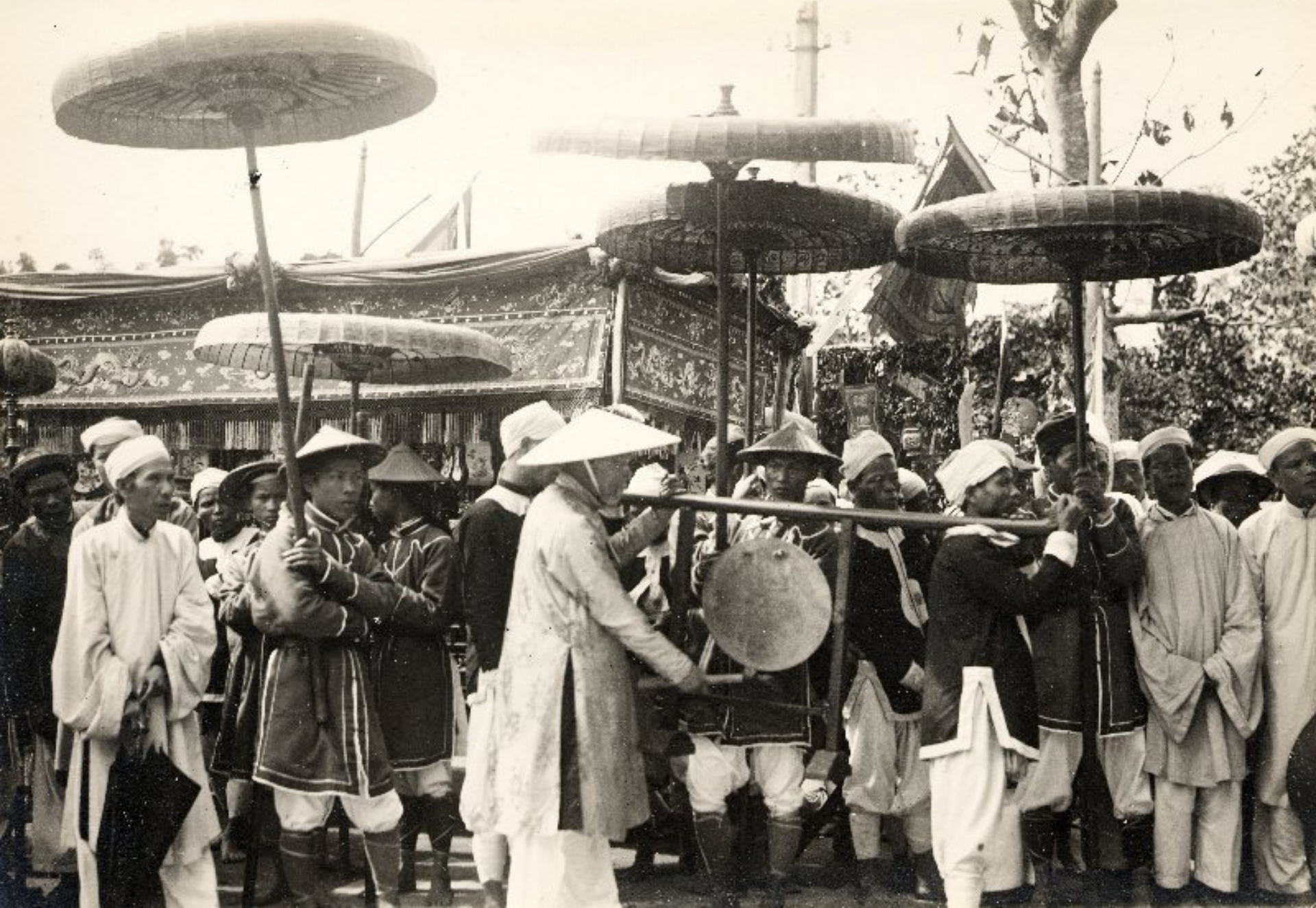
► Kiệu tang