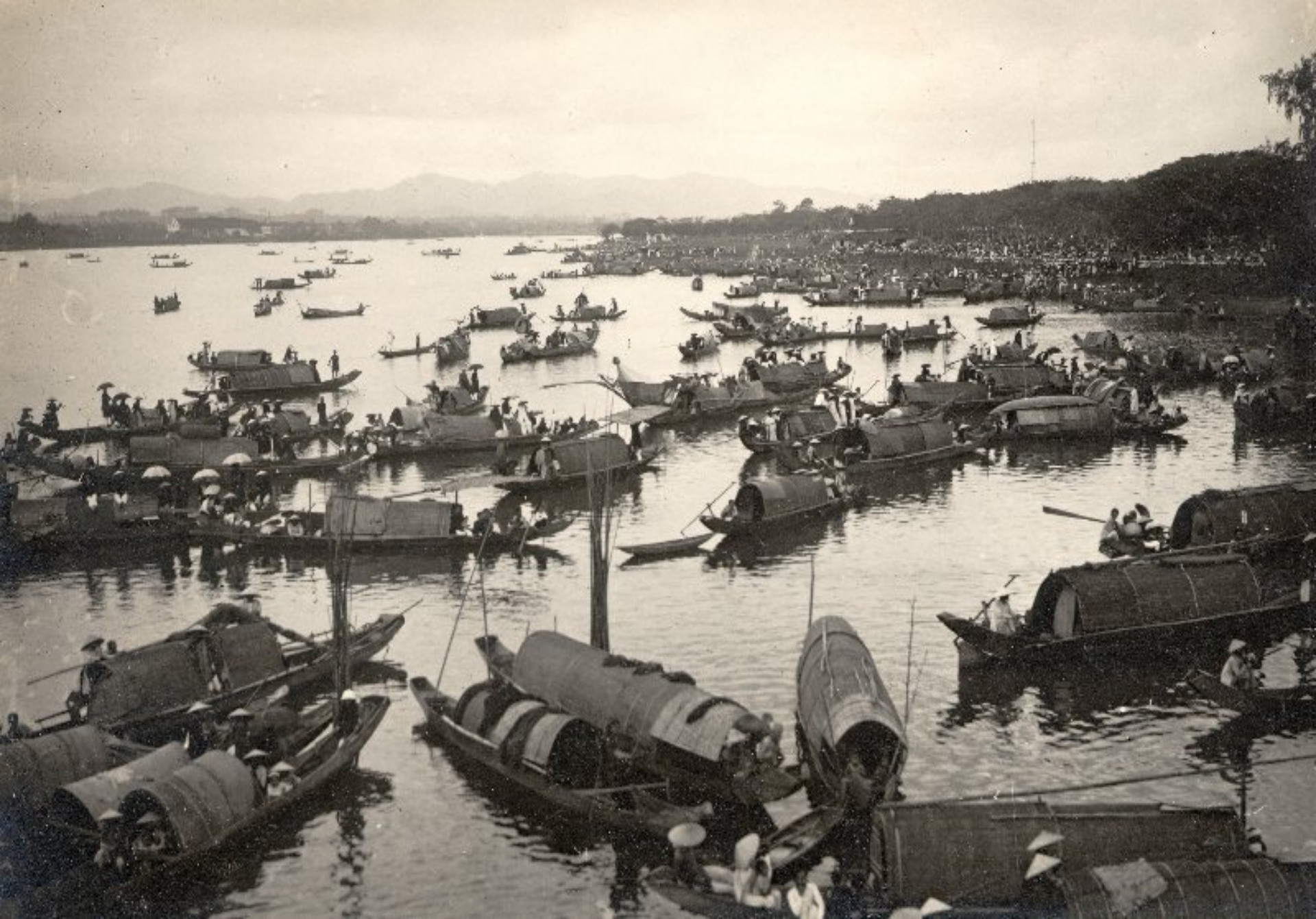
► Dân chúng đi coi trên sông Hương