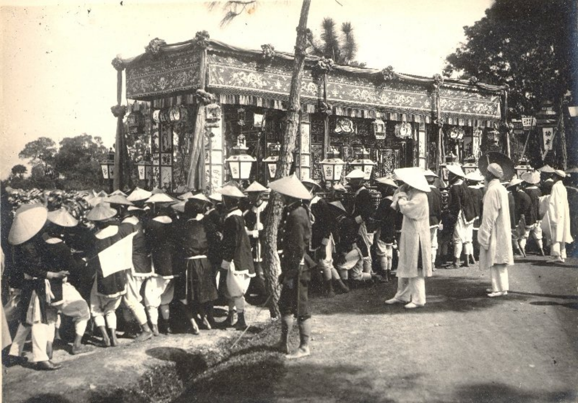
► Kiệu tang