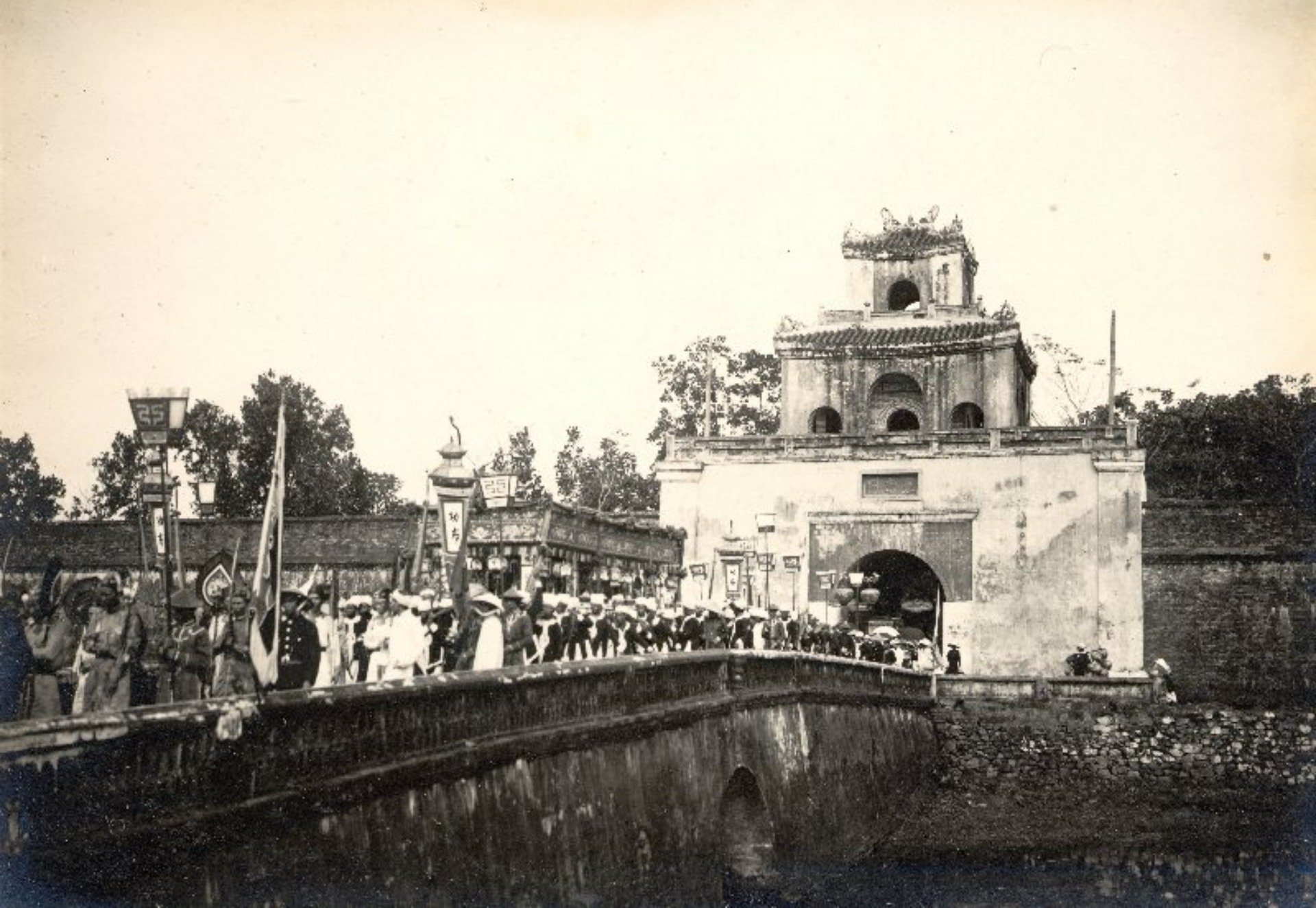
► Đoàn đưa đám đi ra cổng thành