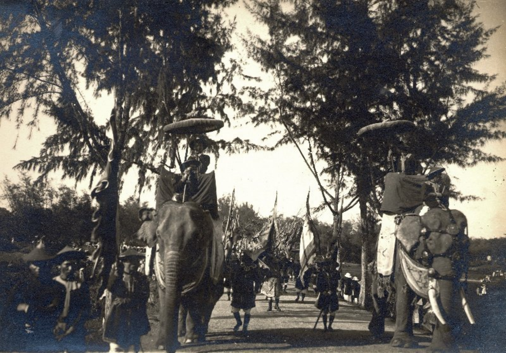
► Đàn voi đi mở đường