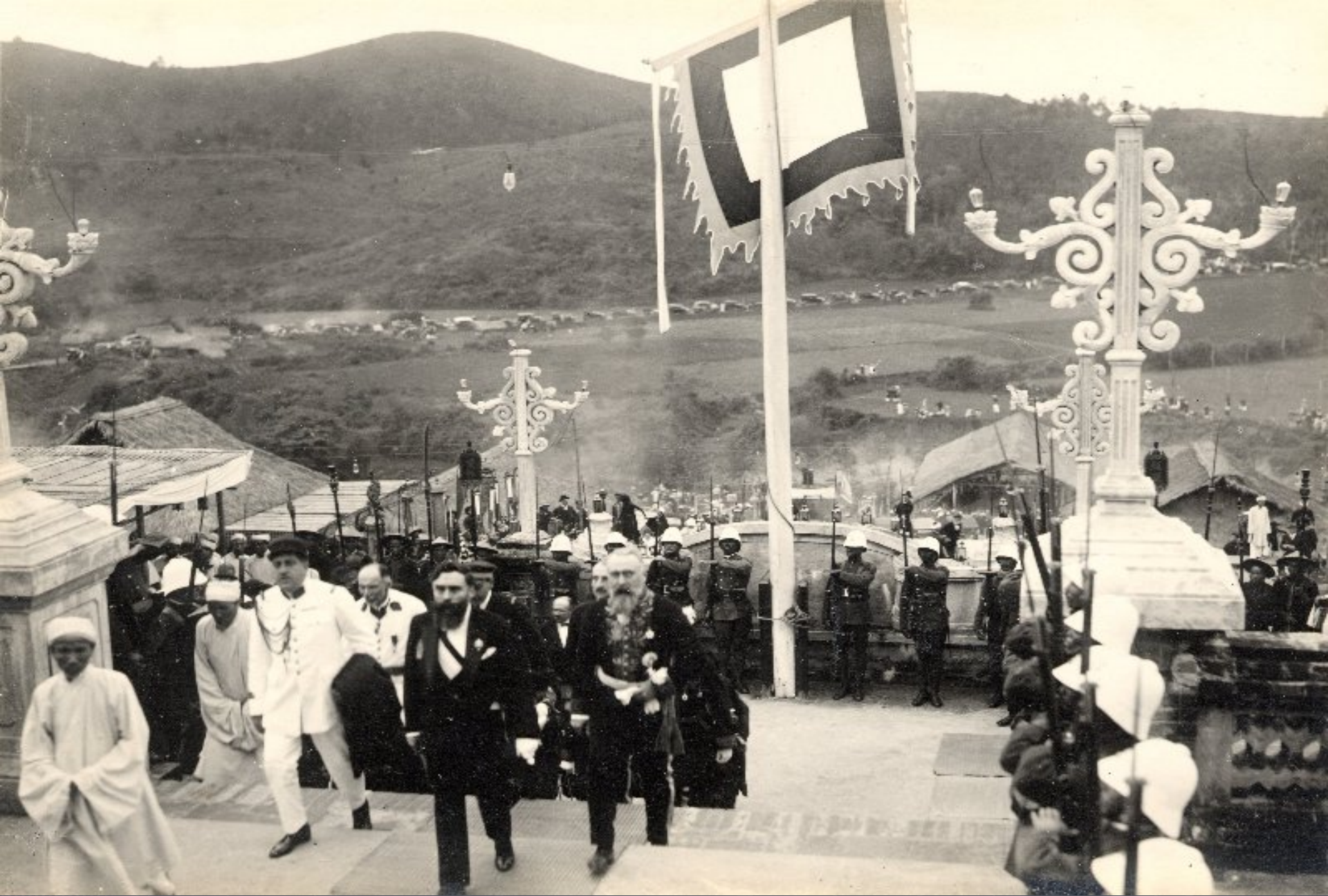
► Toàn quyền Pháp đến dự lễ