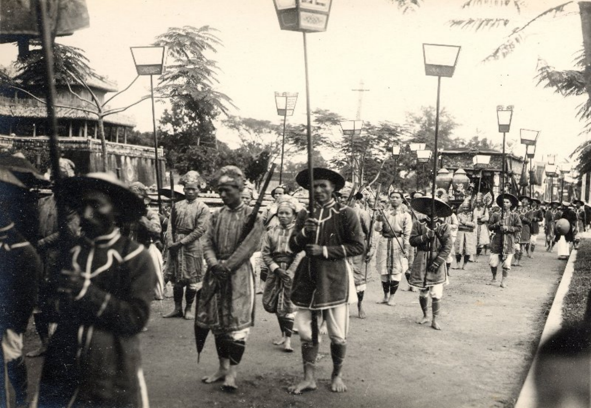
▶ Lồng đèn giấy