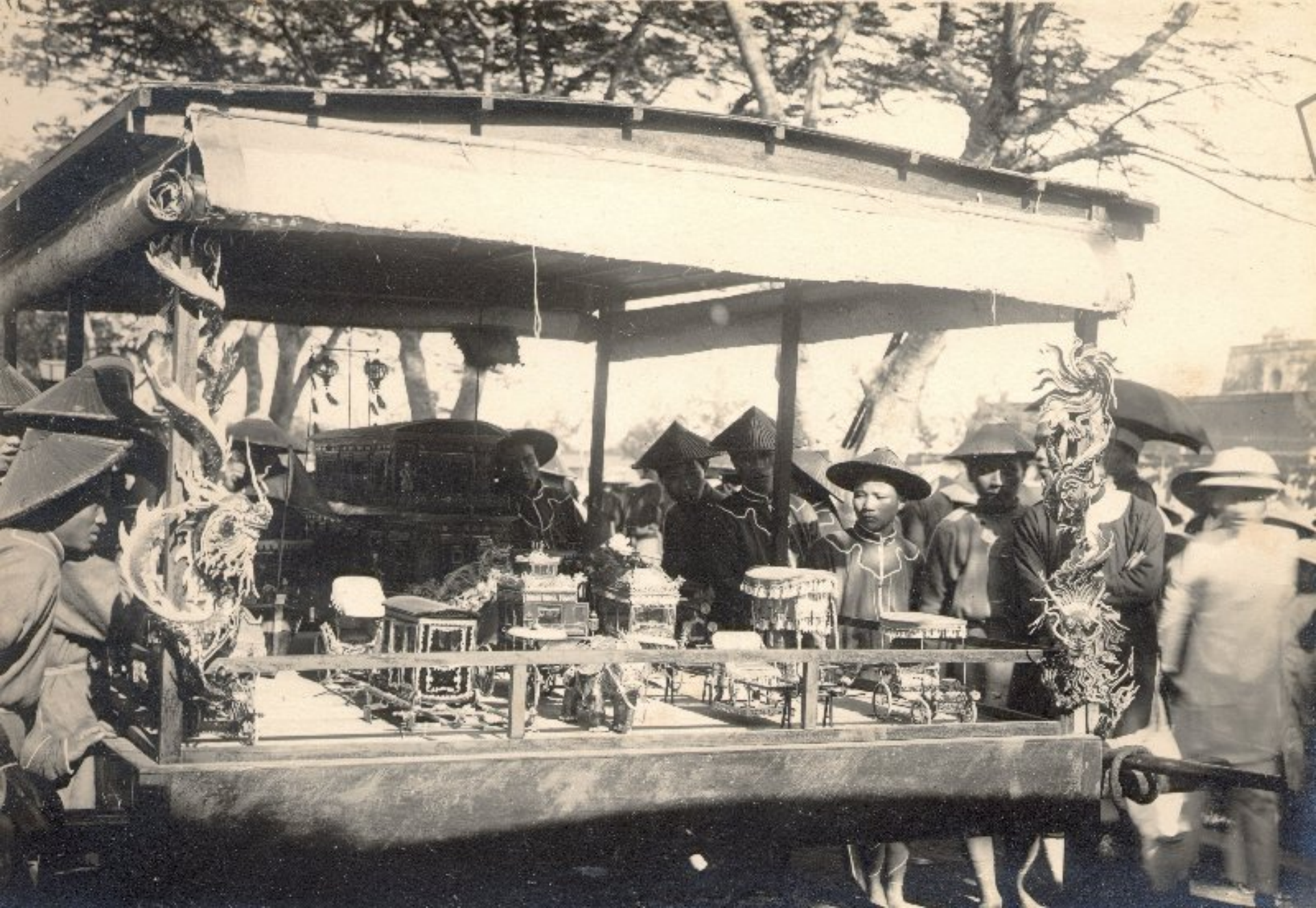
► Đồ mả (xe cộ, nhà cửa,... bằng giấy)