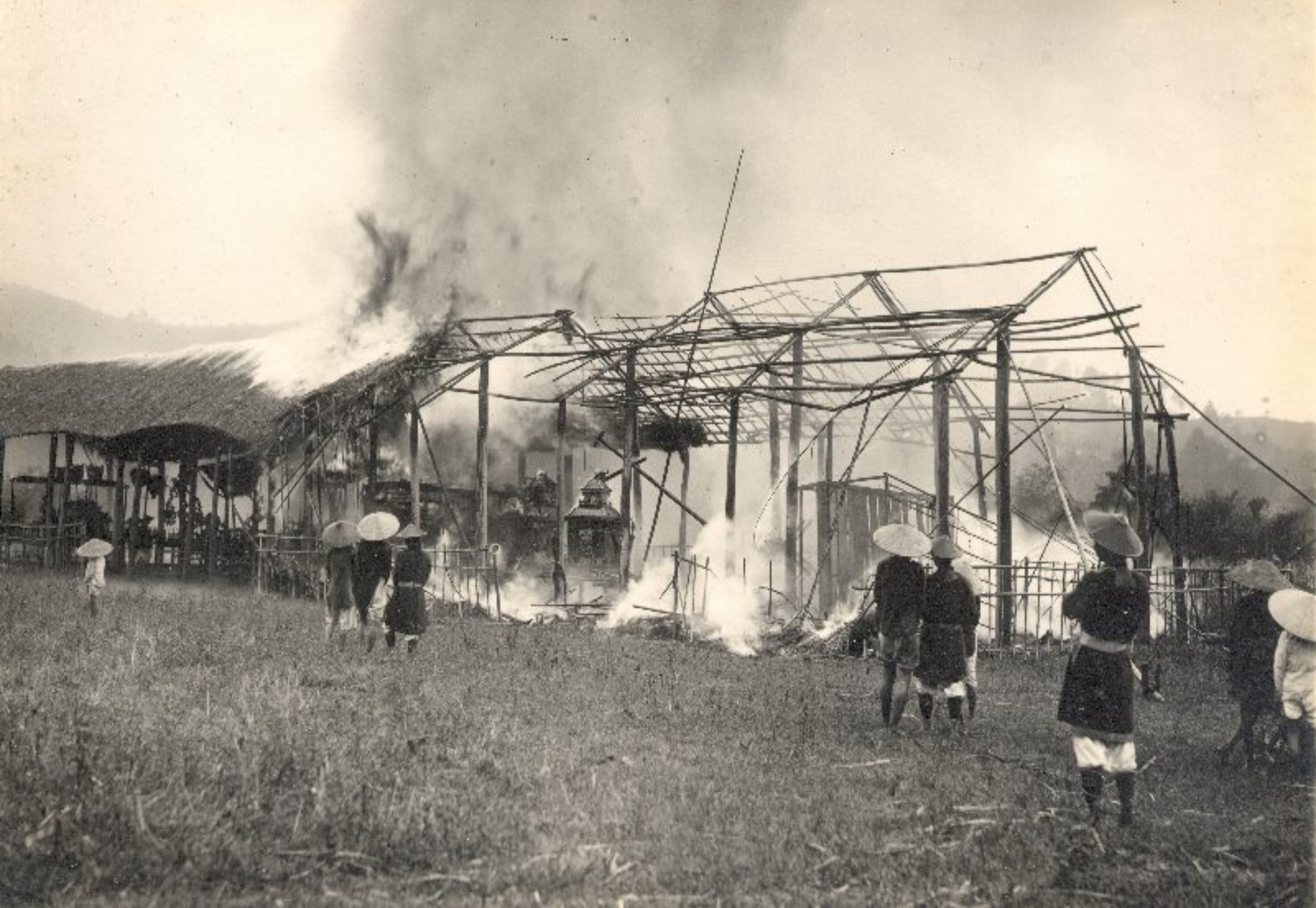
► Đốt đồ mả (cho vua dùng ở thế giới bên kia)