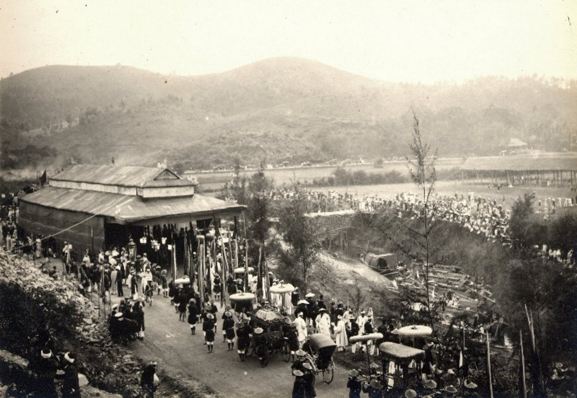
► Đến nhà trạm trước lăng