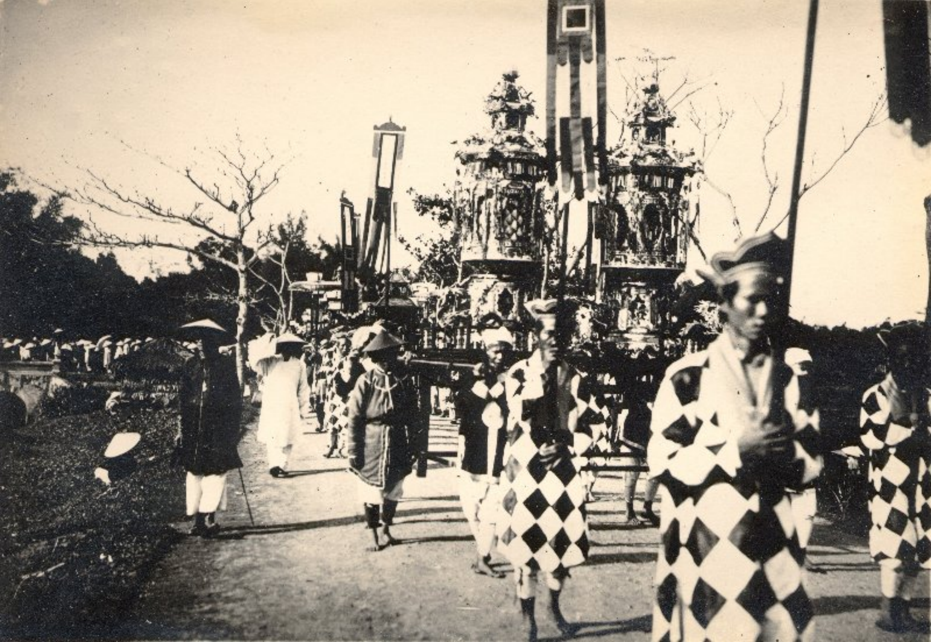
► Các sư dẫn hương linh