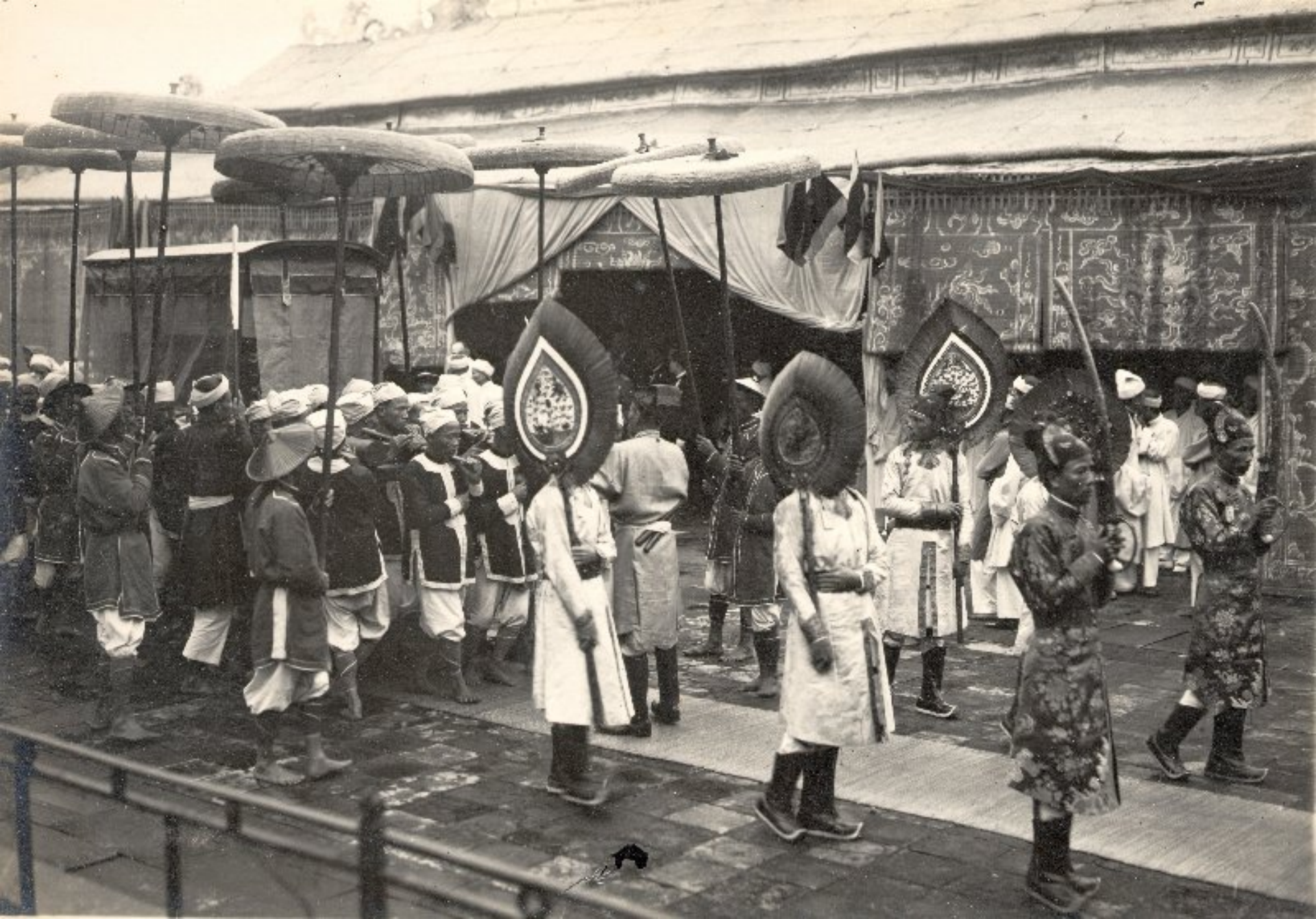
► Lễ động quan ở điện Can Thanh