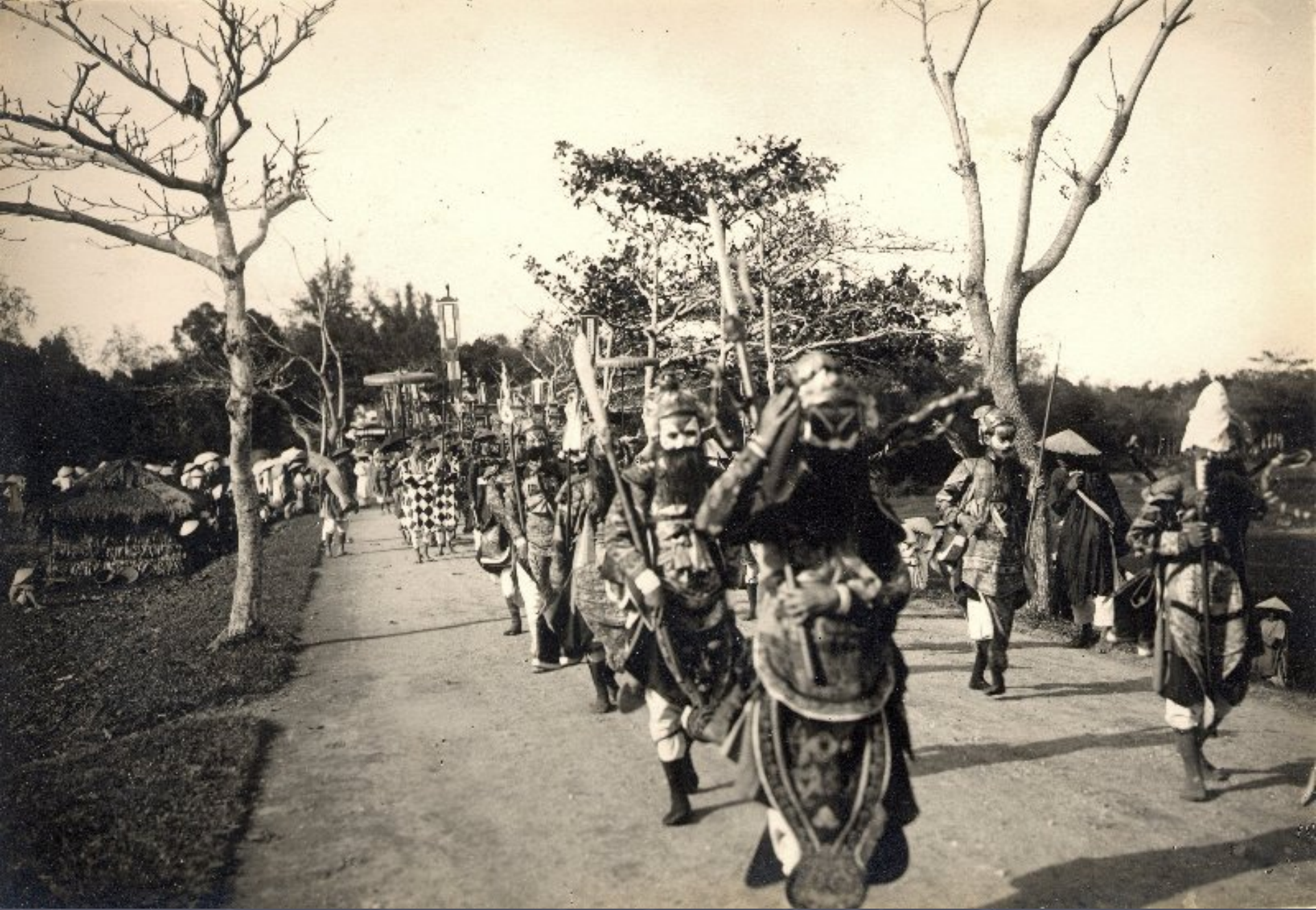
► Đoàn hát