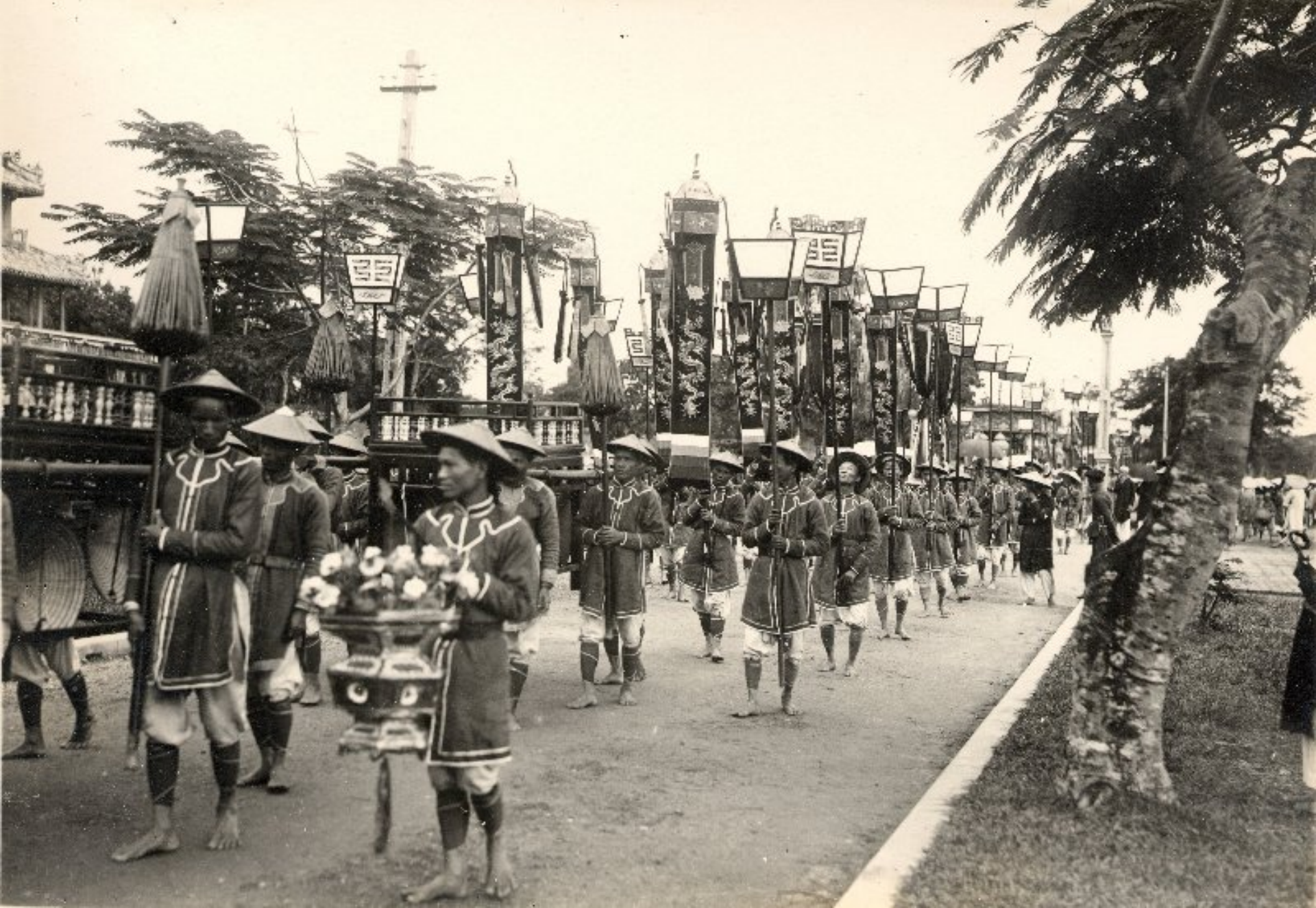
► Đoàn đưa đám