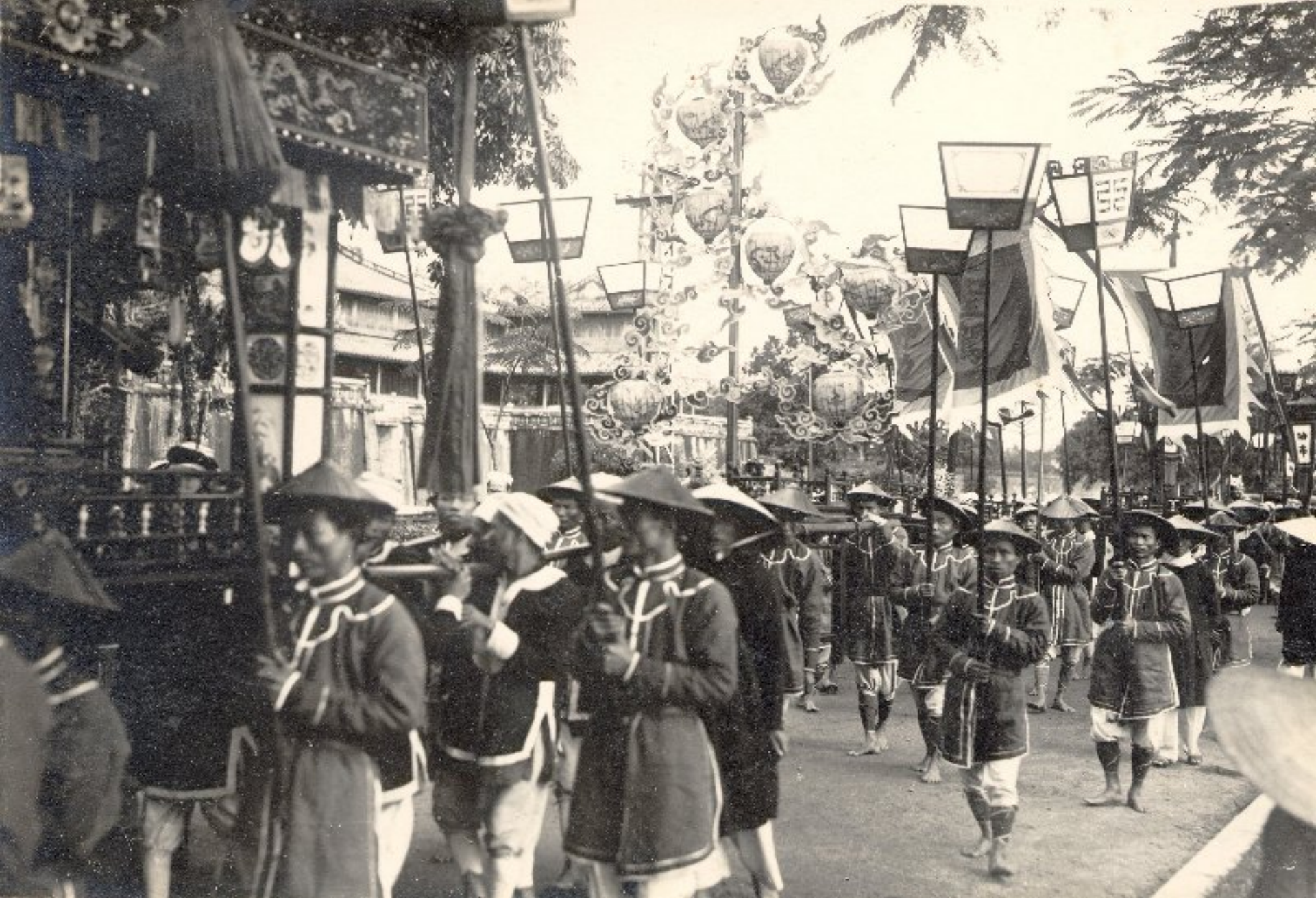
► Lồng đèn giấy