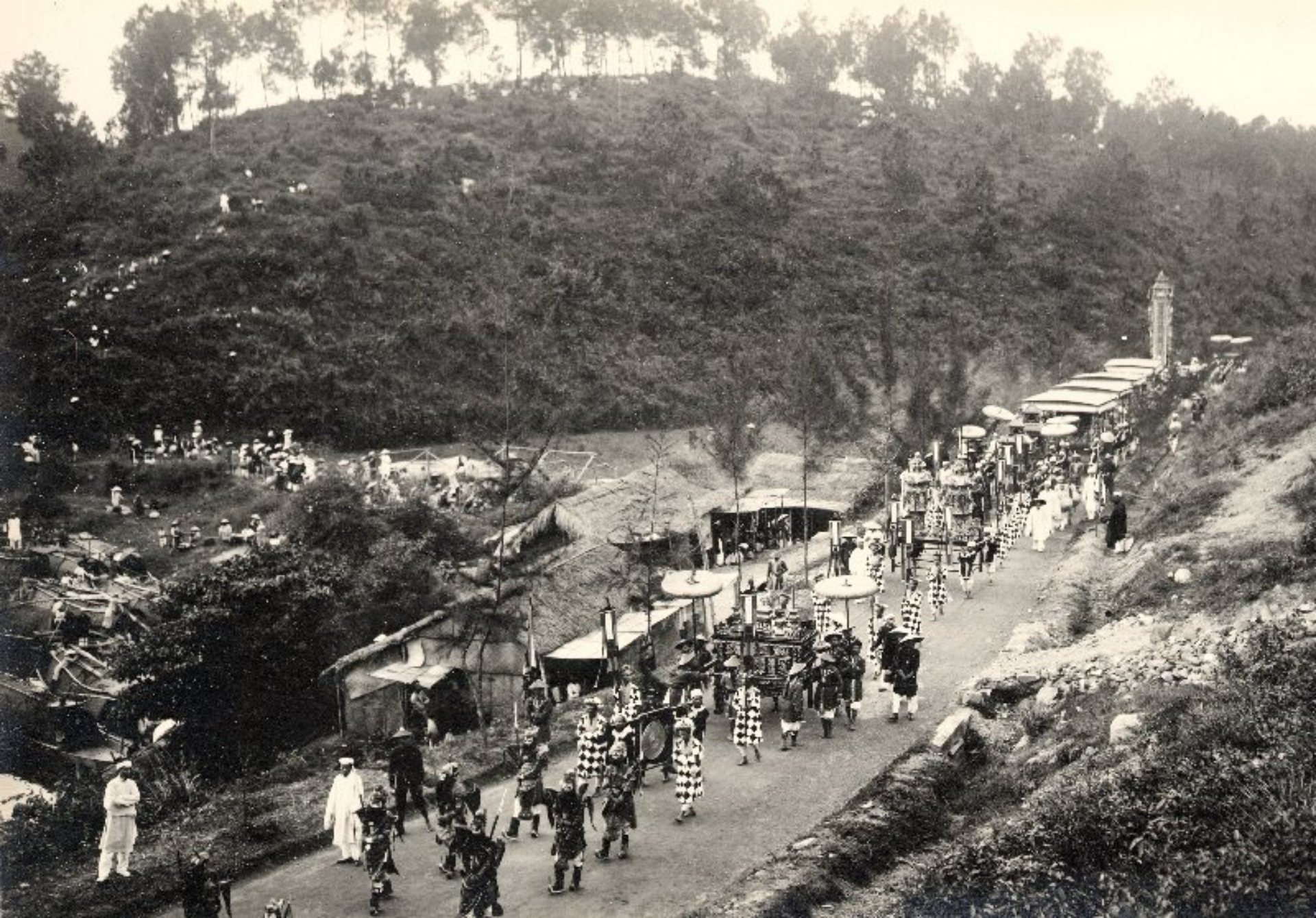
► Đoàn đưa đám đi qua vùng Châu E