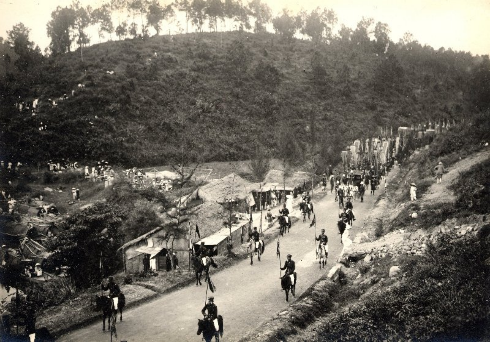
► Đoàn đưa đám đi qua vùng Châu E