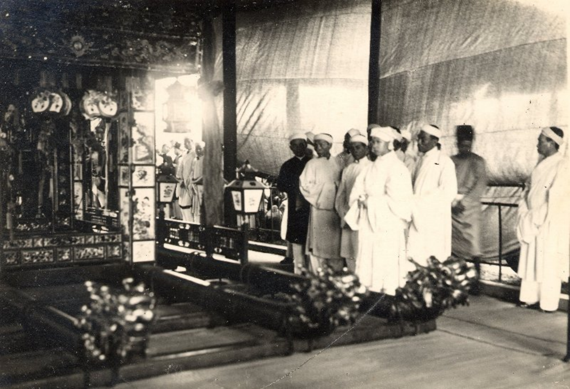
► Vua Bảo Đại mặc tang phục đứng kế bên quan tài